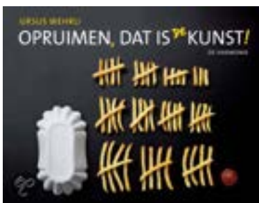
Ursus Wehrli, Opruimen dat is de kunst!